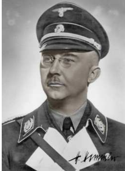
Reichsführer Heinrich Himmler 1900-1945

Questo testo e' dedicato in affettuosa memoria a